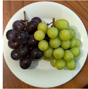
シャインマスカットと新種の富士の輝テーブルに出すと歓声があがりました。