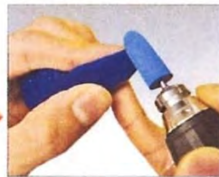
ウレタンビットを用い研磨します。