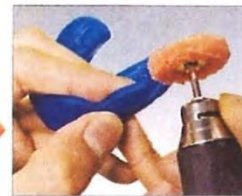
マウスガードホイールを用いて研磨し、さらに滑らかにします。