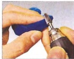
カーバイトバーを用い、カット面を形態修正します。