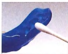
綿棒を用いてマウスガードフィニッシャーを塗布します。