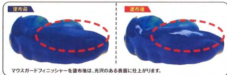
マウスガードフィニッシャーを塗布後は、光沢のある表面に仕上がります。