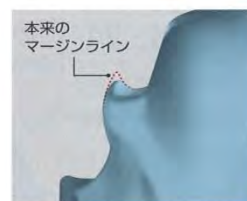
②鋭利な箇所がスキャニングできず、短く丸くなって、マージンの位置や長さが変わる。