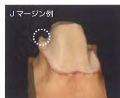
①丸で囲んだ部分がJマージンの鋭利な箇所であり、光が正確に反射されず、エラーが生じやすい。

又、スキャニングが出来たとしてもマージンの鋭利な箇所が短く丸くなってしまい、完成した補綴物を模型に合わせても良好な適合が得られない事が多くなります。