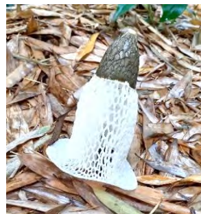
スポンタケ目スポン科スポンタケ属に属するキノコの種類 英名 long net stinkhorn veiled lady