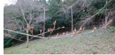
何の芽でしょう？不勉強ですみません。