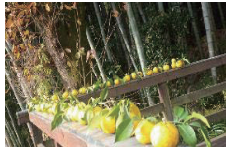
子供たちが並べた日なたの柚子。こんなにたくさん採れました。